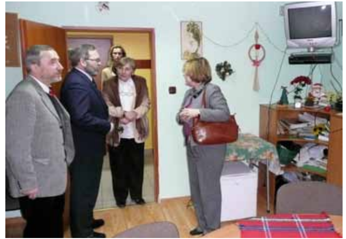
Besichtigung des Internats

Nach einem weiteren guten polnischen Mittagessen in der Mensa besprachen wir das weitere Vorgehen unserer Partnerschaft unter dem Aspekt der europäischen Förderung durch das Programm Leonardo da Vinci. Die polnische Schule hatte auf Grund der Erfahrung von bereits bestehenden Partner-