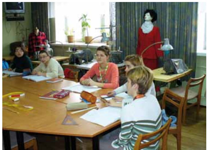
Klassenraum der Schneiderei