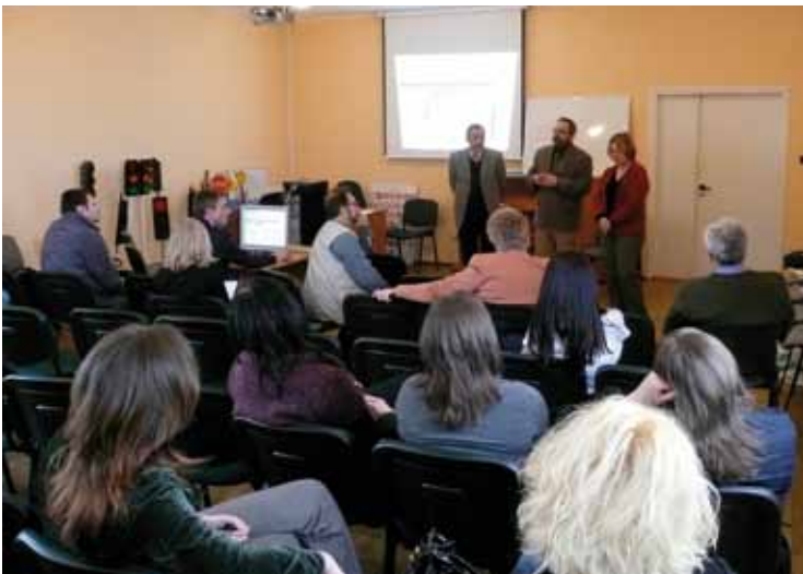
Präsentation unserer Schule vor dem polnischen Kollegium