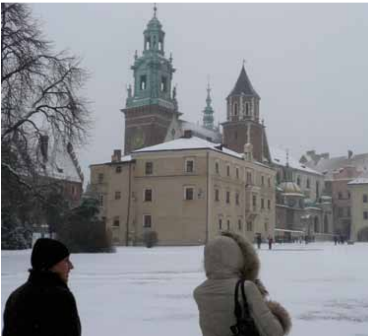
Auf dem Wawal-Hügel im verschneiten Krakau