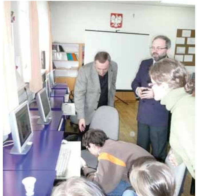
Besichtigung der Klassenräume - EDV-Raum