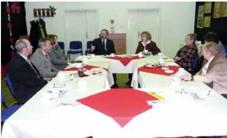
Begrüßung in der Aula der Hörgeschädigteneinrichtung

Nach der herzlichen Begrüßung in der Aula wurden wir von mehreren Personen der Schulleitung durch die Klassenräume der Berufsschule und durch das Internat geführt. Wir bekamen angenehme und gut ausgestattete Klassenräume und saubere Zimmer des angegliederten Internats zu sehen. Bei den Kolleginnen und Kollegen spürte man sofort: